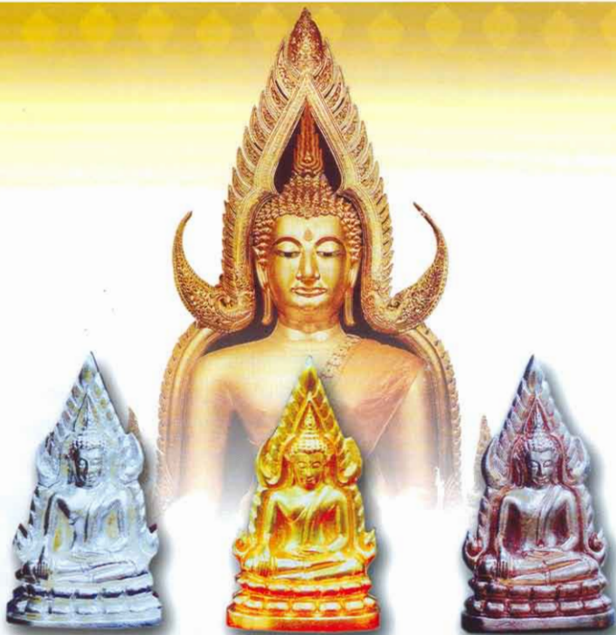
เขี้ยวเงิน