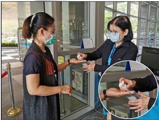
2. ล้างมือด้วยแอลกอฮอล์