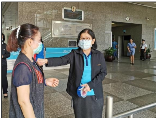
4. ติดสติ๊กเกอร์