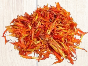
ดอกคำฝอย

ฉบับนี้เรามารู้จักสมุนไพรใกล้ตัวที่อยู่ในกลุ่มของยาลดไขมันในเลือด ซึ่งส่วนใหญ่เป็นไม้ใกล้ตัวที่เราไม่ต้องไปซื้อหาด้วยราคาแพง หลายๆ ท่านคงคาดไม่ถึงว่า ไม้ต่อไปนี้เป็นสมุนไพรที่มีคุณสมบัติในการลดไขมันในเส้นเลือดให้เราได้ หากจะเอ่ยถึง กระเจี๊ยบ คำฝอย เสาวรส ส่วนเป็นชื่อที่เราคุ้นเคย ก็นี่ก็มาทำความรู้จักให้มากขึ้นอีกหน่อย เริ่มจาก กระเจี๊ยบ สรรพคุณที่มีก็คือ กลีบเลี้ยงของดอก หรือกลีบที่ห่ออยู่กัผลเป็นยาลดไขมันในเส้นเลือด และช่วยลดน้ำหนักด้วย หรือสามารถลดความดันโลหิตได้โดยไม่มีผลร้ายแต่อย่างใด ทั้งนี้ เพราะน้ำกระเจี๊ยบทำให้ความหนืดของเลือดลดลงและยังช่วยรักษาโรคเส้นโลหิตแข็งประปรายได้ดี ที่สำคัญน้ำกระเจี๊ยบยังมีฤทธิ์ขับปัสสาวะเป็นการช่วยลดความดันอีกทางหนึ่ง และกระเจี๊ยบก็ยังช่วยย่อยอาหาร เพราะไม่เพิ่มการหลั่งของกรดในกระเพาะ แต่กลับเพิ่มการหลั่งน้ำดีจากตับ กระเจี๊ยบยังเป็นเครื่องดื่มที่ช่วยให้ร่างกายสดชื่น เพราะมีกรดซิตริกอยู่ด้วย ประโยชน์ยังมีอีกในส่วนของใบ แก้โรคพยาธิตัวจิ๊ด เป็นยาแก้ลมพิษ แก้ไอ ขับเมือกมันในลำคอ ให้อุณหภูมิร่างกายต่ำ แต่ดอกที่แดงสดยังแก้โรคนิวโมโต แก้โรคนิวโมในกระเพาะปัสสาวะ ริดสีดวง ไล่พยาธิในลำไส้ให้อุณหภูมิร่างกายต่ำ ส่วนผลช่วยลดไขมันในเส้นเลือด แก้กระหายน้ำ รักษาแผลในกระเพาะ สูดถ่าย เมล็ดช่วยบำรุงธาตุ บำรุงกำลัง แก้ดีพิการ ขับปัสสาวะ ลดไขมันในเส้นเลือด