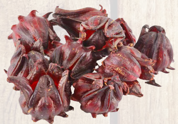
กระเจี๊ยบ

สมเด็จพระเทพรัตนราชสุดาฯ สยามบรมราชกุมารี