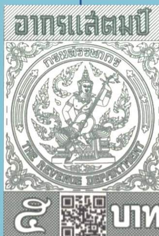
อากรแสตมป์ 5 บาท