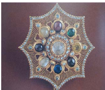
ดารานพรัตน์

ต่อมาทรงพระกรุณาโปรดเกล้าฯ ให้สร้างเครื่องราชอิสริยาภรณ์หรือเครื่องประดับสำหรับ ยศอื่น ๆ เป็นลำดับมา เช่น ดารานพรัตน์ - ใช้ประดับที่เสื้อแสดงยศอย่างสูงสำหรับฉลองพระองค์ เป็นเครื่องต้น และพระราชทานพระบรมวงศานุวงศ์ ดาราช้างเผือก - ซึ่งเป็นเครื่องหมายหมายถึงแผ่นดินสยาม ดาราตราตำแหน่ง - สำหรับข้าราชการชั้นผู้ใหญ่ที่มีตำแหน่งสำคัญ เช่น ตำแหน่งพระสมุหพระกลาโหม (ดาราดราราชสีห์) เป็นต้น