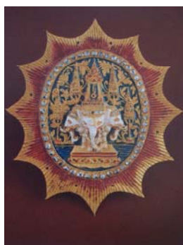
ดาราไอรภาพต (เครื่องต้น)

ดาราไอรภาพตเป็นดาราดวงแรกซึ่งพระบาทสมเด็จพระจอมเกล้าเจ้าอยู่หัว ทรงสร้างขึ้น สำหรับเป็นเครื่องทรงของพระมหากษัตริย์ โดยทรงนำแบบอย่างมาจากกลดลายของตราอันหมายถึง องค์พระมหากษัตริย์ ซึ่งเรียกว่า พระราชลัญจกร ไอรภาพตเป็นรูปช้าง ๓ เศียร มีฉัตรเครื่องสูงข้างละ ๒ คัน ประกอบด้วยทางด้านซ้ายและขวา