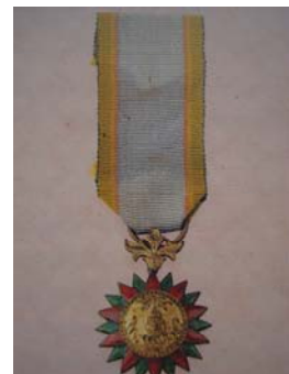
วิจิตรภรณ์ (ว.ม.)