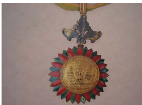
มัณฑนาภรณ์ (ม.ม.)