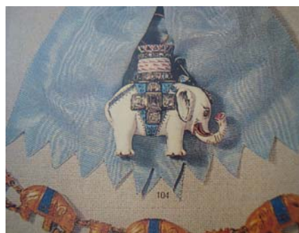
เครื่องราชอิสริยาภรณ์เดนมาร์ก “The Order of Elephant”