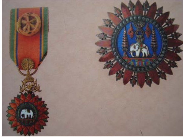
จูลวารามณ์ พ.ศ. ๒๔๑๖