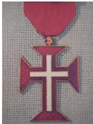
เครื่องราชอิสริยาภรณ์โปรตุเกส “The Order of Christ”