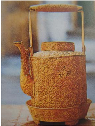
กาน้ำทองคำ