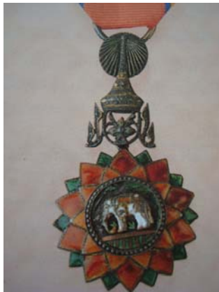
ทิพยามณ์ พ.ศ. ๒๔๑๖