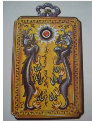
เครื่องราชอิสริยาภรณ์จีน “The order of Double Dragon”