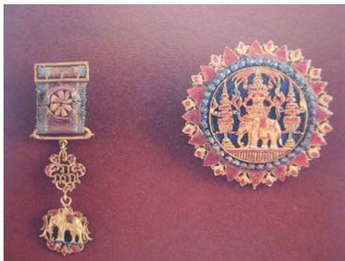
จลวราภรณ์