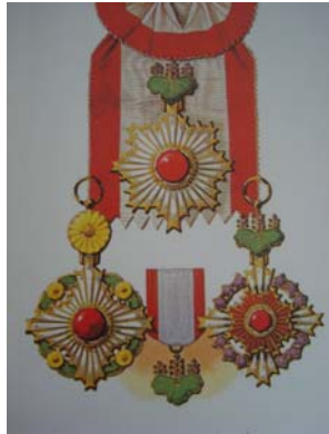
เครื่องราชอิสริยาภรณ์ญี่ปุ่น “The Order of the Rising Sun”

การใช้เครื่องราชอิสริยาภรณ์ตามแบบอย่างประเทศตะวันตกนั้น เกิดขึ้นในประเทศไทยเป็นประเทศแรกในเอเชีย ต่อจากนั้นประเทศญี่ปุ่นและประเทศจีน จึงได้คิดค้นเครื่องราชอิสริยาภรณ์ขึ้น