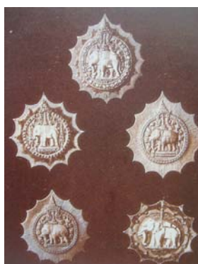
ดาราช้างเผือก