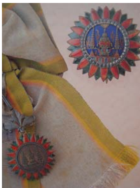
มหาสุรภรณ์ (ม.ส.ม.)

รัชสมัยพระบาทสมเด็จพระจุลจอมเกล้าเจ้าอยู่หัว ได้ทรงพระกรุณาโปรดเกล้าฯ ให้สร้างเครื่องราชอิสริยาภรณ์อันเป็นที่เชิดชูยิ่งมงกุฎไทย ซึ่งเดิมมีชื่อว่า “เครื่องราชอิสริยยศความชอบอย่างสูงสุด มงกุฎสยาม” ขึ้น เมื่อจุลศักราช ๑๒๓๑ (พ.ศ. ๒๔๑๒) โดยจัดแบ่งออกเป็น ๑) มหาสุรภรณ์ ๒) จุลสุรภรณ์ ๓) ภัทรภรณ์ ต่อมาเมื่อ พ.ศ. ๒๔๑๖ ได้จัดแบ่งเป็น ๕ ชั้น ได้แก่ ชั้นที่ ๑ มหาสุรภรณ์ (ม.ส.ม.) ชั้นที่ ๒ จุลสุรภรณ์ (จ.ม.) ชั้นที่ ๓ มัณฑนาภรณ์ (ม.ม.) ชั้นที่ ๔ ภัทรภรณ์ (ภ.ม.) และชั้นที่ ๕ วิจิตรภรณ์ (ว.ม.) ดังรูป