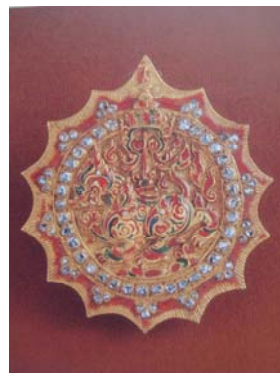
ดาราดราราชสีห์

เครื่องหมายดังกล่าวนี้ ภาษาสากลเรียกว่า Star พระบาทสมเด็จพระจอมเกล้าเจ้าอยู่หัว ทรงบัญญัติศัพท์ว่า “ดารา” และยังคงใช้คำนี้ในการเรียกดารา ซึ่งเป็นส่วนประกอบของเครื่องราชอิสริยาภรณ์ไทย สำหรับชั้นที่ ๒ ขึ้นไปจนถึงชั้นสายสะพายมาจนถึงปัจจุบัน