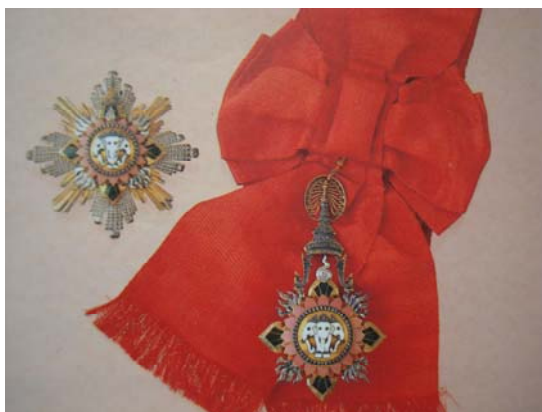
มหาปรมาภรณ์ พ.ศ. ๒๔๕๒

พ.ศ. ๒๔๕๒ ได้ทรงพระกรุณาโปรดเกล้าฯ ให้ตราพระราชบัญญัติเครื่องราชอิสริยาภรณ์ช้างเผือก ร.ศ. ๑๒๘ ขึ้นใหม่ เพื่อเปลี่ยนรูปแบบของเครื่องราชอิสริยาภรณ์และแก้ไขลำดับชั้นเครื่องราชอิสริยาภรณ์ให้บริบูรณ์งดงามขึ้น เช่น เพิ่มชั้นสูงสุด โดยให้มีชื่อว่า มหาปรมาภรณ์ช้างเผือก โดยกำหนดรูปลักษณะที่ใช้อยู่จนปัจจุบัน ฯลฯ