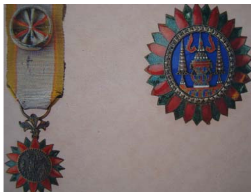
จุลสุรภรณ์ (จ.ม.)