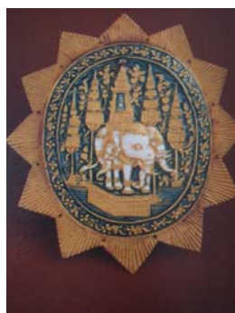
ดาราไอรภาพต (องค์รอง)