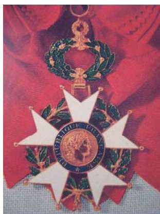
เครื่องราชอิสริยาภรณ์ “Grand Cross”

เครื่องราชอิสริยาภรณ์ของชาวยุโรปมีกำเนิดมาเป็นเวลาช้านานในประเทศต่าง ๆ เช่น ประเทศโปรตุเกส สร้างขึ้นเพื่อเป็นบำเหน็จความกล้าหาญในการทำสงครามระหว่างชาวโปรตุเกสกับผู้นับถือศาสนาอิสลามผู้รุกรานประเทศ เครื่องราชอิสริยาภรณ์ของโปรตุเกสชื่อ The Order of Aviz นับเป็นเครื่องราชอิสริยาภรณ์ที่เก่าแก่ที่สุดของยุโรป สร้างสมัยพุทธศตวรรษที่ ๑๗ ตรงกับ พ.ศ. ๑๖๘๓ (ค.ศ. ๑๑๔๐) ซึ่งเป็นช่วงระยะก่อนการสร้างกรุงสุโขทัยเป็นราชธานี นอกจากนี้โปรตุเกสยังมีเครื่องราชอิสริยาภรณ์ชื่อ The order of the Tower and the Sword และเครื่องราชอิสริยาภรณ์ชื่อ The Order of Christ ซึ่งสร้างในพุทธศตวรรษที่ ๑๙ หรือในประเทศเดนมาร์ก ได้ใช้รูปช้างเป็นเครื่องหมายของเครื่องราชอิสริยาภรณ์ ใน พ.ศ. ๒๐๕๑ (ค.ศ. ๑๕๐๘) ซึ่งตรงกับสมัยพระรามาธิบดีที่ ๒ แห่งกรุงศรีอยุธยา ถือเป็นเครื่องราชอิสริยาภรณ์ชั้นสูงสุด มีชั้นเดียว คือ The Order of the Elephant