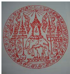
ดวงตราไอรภาพต

ดาราไอรภาพตเป็นดาราดวงแรกซึ่งพระบาทสมเด็จพระจอมเกล้าเจ้าอยู่หัว ทรงสร้างขึ้น สำหรับเป็นเครื่องทรงของพระมหากษัตริย์ โดยทรงนำแบบอย่างมาจากกลดลายของตราอันหมายถึง องค์พระมหากษัตริย์ ซึ่งเรียกว่า พระราชลัญจกร ไอรภาพตเป็นรูปช้าง ๓ เศียร มีฉัตรเครื่องสูงข้างละ ๒ คัน ประกอบด้วยทางด้านซ้ายและขวา