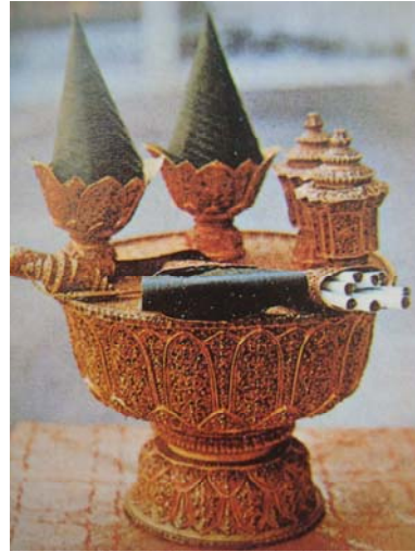
พานหมากทองคำ

ในสมัยกรุงศรีอยุธยาได้มีเครื่องราชูปโภคสำหรับพระพิชัยสงครามอย่างหนึ่ง เรียกว่า พระสังวาลพระนพ เป็นสายพระสังวาล ใช้สวมเฉียงพระอังสาซ้ายหรือขวา มีลักษณะเป็นสร้อยอ่อนทำด้วยทองคำล้วนเรียงกัน ๓ สาย สายหนึ่งยาวประมาณ ๑๒๔ เซนติเมตร มีดอกประจำยามทำด้วยทองคำประดับ นพรัตนหนึ่งดอก เมื่อมีการประกอบพระราชพิธีบรมราชาภิเษกเสด็จขึ้นประทับพระที่นั่งภัทรบิฐ (พระที่นั่งสำหรับพระมหากษัตริย์ เสด็จขึ้นประทับทรงรับเครื่องเบญจราชกกุธภัณฑ์ เครื่องบรมราชูปโภคอันเป็นโบราณมงคล พระแสงอัฐมาวุธ และพระแสงศาสตราวุธในพระราชพิธีบรมราชาภิเษก) พราหมณ์ จะทูลเกล้าฯ ถวายพระสังวาลนี้สำหรับพระมหากษัตริย์ทรงสวมพระองค์ก่อนที่จะทรงรับเครื่องอิสริยยศอื่น ๆ เป็นราชประเพณีสืบมาจนถึงปัจจุบัน