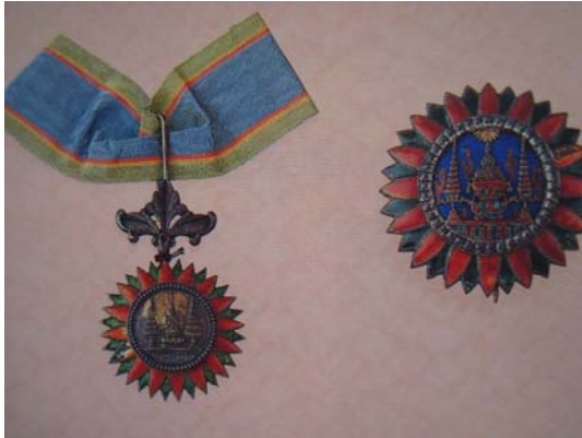
จตุรสารภรณ์ พ.ศ. ๒๔๓๒

๒) เปลี่ยนหลักการพระราชทาน ซึ่งแต่เดิมพระราชทานเป็นสิทธิ เป็นพระราชทานให้ประดับเป็นเกียรติยศ เมื่อผู้รับพระราชทานวายชนม์ ทายาทต้องส่งคืน