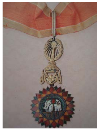
นิภามณ์ พ.ศ. ๒๔๑๖