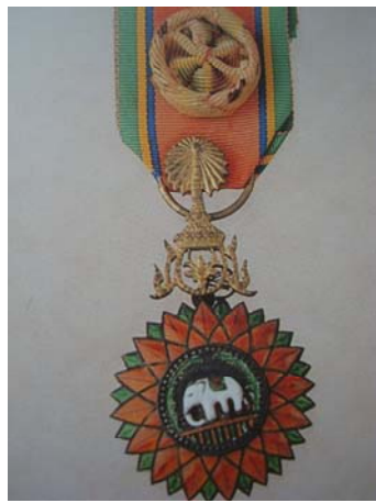
กษณามณ์ พ.ศ. ๒๔๑๖