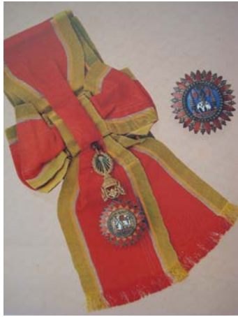
มหาวารามณ์ พ.ศ. ๒๔๑๖