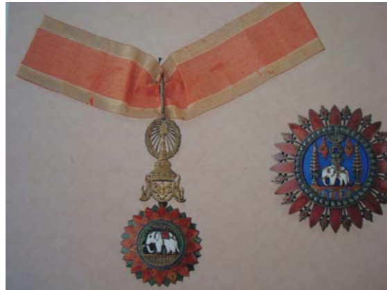
จูลวารามณ์ พ.ศ. ๒๔๓๒

พ.ศ. ๒๔๓๒ โปรดเกล้าฯ ให้มีประกาศพระราชบัญญัติเครื่องราชอิสริยาภรณ์แก้ไขเพิ่มเติม โดย ๑) เปลี่ยนชื่อจาก “เครื่องราชอิสริยยศความชอบอย่างสูงสุดข้างเผือก” เป็น “เครื่องราชอิสริยาภรณ์อันเป็นที่เชิดชูยิ่งช้างเผือก” ๒) เปลี่ยนหลักการพระราชทาน ซึ่งแต่ก่อนพระราชทานให้เป็นสิทธิเป็นพระราชทานให้ประดับเป็นเกียรติ เมื่อผู้รับพระราชทานวายชนม์ ทายาทต้องส่งคืน และ ๓) สำหรับกรณีได้รับพระราชทานเลื่อนชั้นสูงขึ้น ก็ให้ส่งดวงตราชั้นต่ำกว่าคืน สำหรับ “หนังสือคำประกาศสำหรับดวงตรา” ให้เรียกว่า “ประกาศนียบัตร”